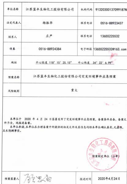
企业事业单位突发环境事件应急预案备案表